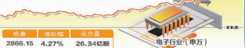
3月30日波动最大行业走势图