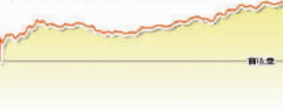
3月30日上证综指走势图