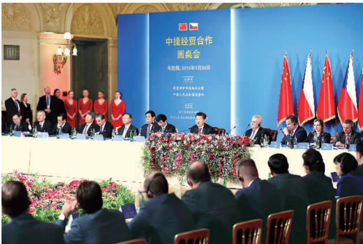
3月30日,国家主席习近平同捷克总统泽曼在布拉格共同出席中捷经贸合作圆桌会。习近平发表题为《传承友谊,继往开来,开启中捷经贸合作新时代》的重要讲话。

战,在合作中实现共同发展。要加强优势互补,以经贸合作为重要抓手,推动中国—中东欧国家合作框架内合作,并共享合作成果。要探索经贸合作和商业模式创新,加强金融、互联网经济、新能源、旅游等领域合作,支持两国企业共建工业和科技园区,培育经贸发展新增长点。要发挥比较优势,开展国际产能合作,实现“中国制造2025”