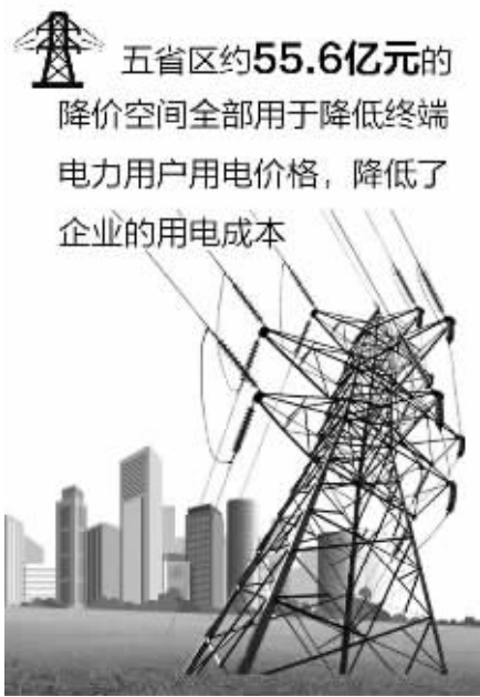
五省区约55.6亿元的降价空间全部用于降低终端电力用户用电价格,降低了企业的用电成本

剔除或核减了约160亿元与电网输配电无关的成本,五省区平均核减比例约为16.3%