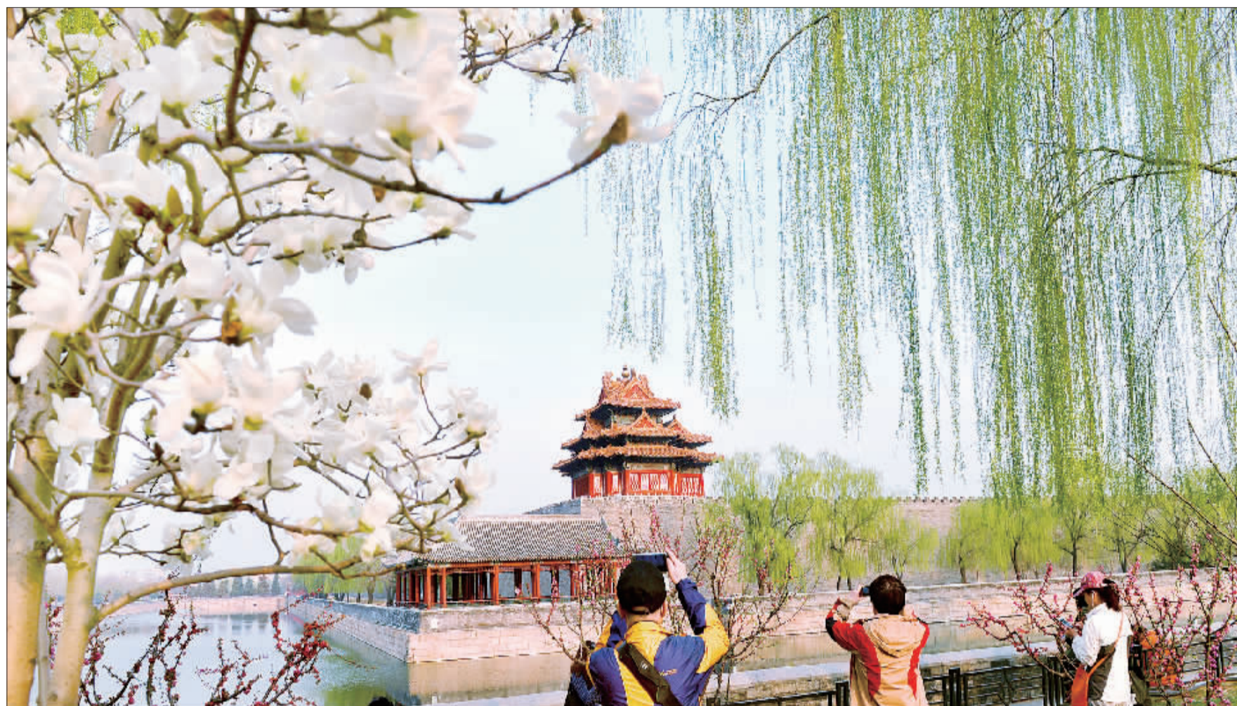
▲3月28日，北京故宫角楼。嫩绿的垂柳和盛放的玉兰相映成趣，吸引了众多游客前来拍照留念。