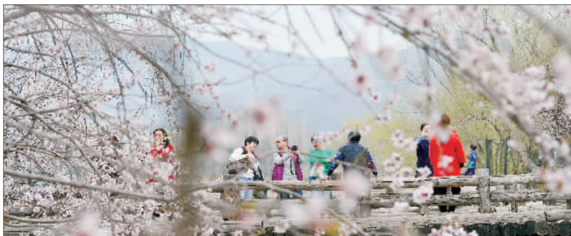
▲3月28日，北京植物园桃花、梅花、海棠等数百个品种的春花陆续绽放。