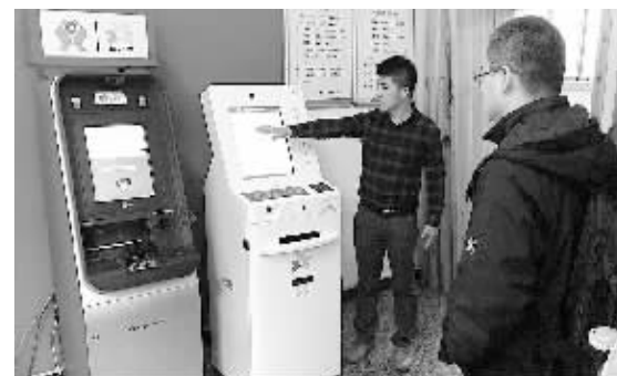
婺源“农村金融便民店”有效整合了村镇银行、自助银行、社区银行的功能。图为信安盟业务员在介绍智能终端设备。

根据信安盟的规划,“金融便民店”模式今年将在江西、四川等地的农村布局3000个网点,届时,这一模式将激活广大农村潜在的生命力和活力,让广大农村迎来新一轮发展生机。