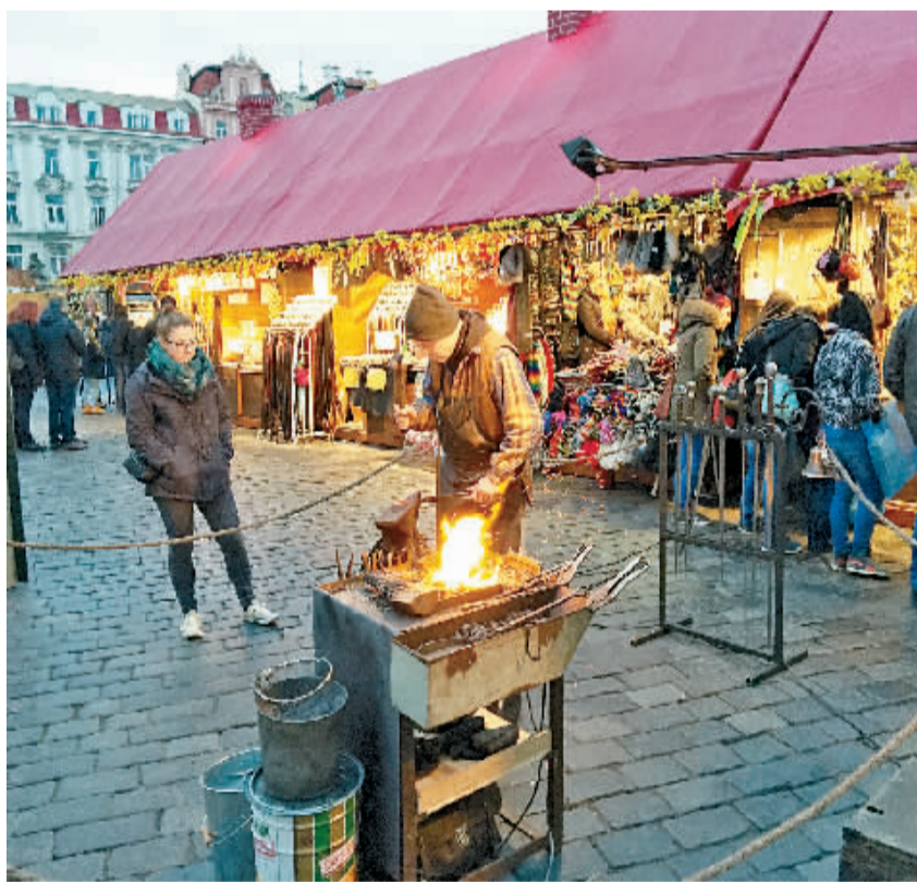
捷克是一个具有深厚人文传统的国家。图为捷克工匠在老城广场表演炼铁工艺。