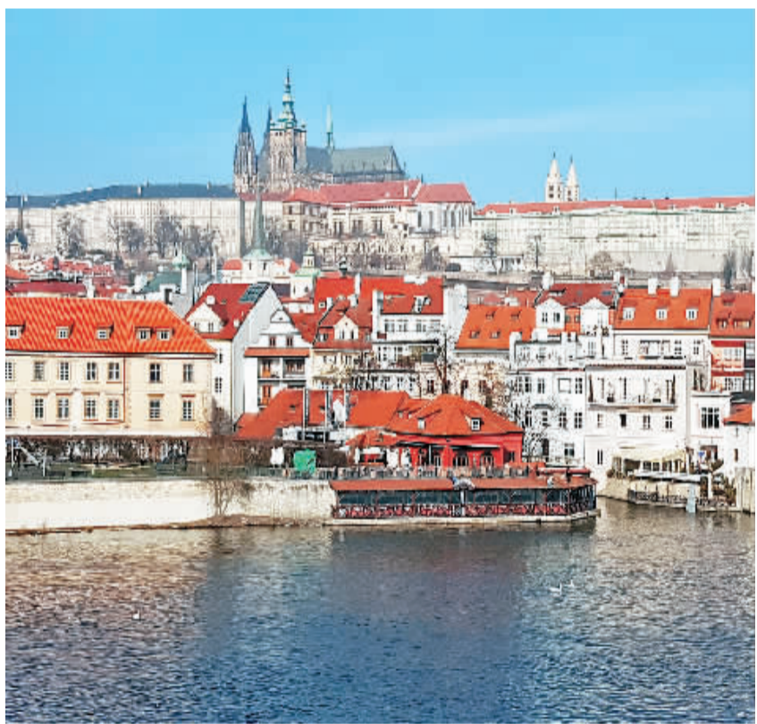
捷克首都布拉格是著名的旅游城市，每年吸引着大量的中国游客。图为布拉格城市一瞥。

不少捷克经济界人士和专家认为，随着中国与中东欧国家合作不断升温，中捷双边经贸合作也将跨上一个新台阶。目前两国关系基础稳固，发展顺利，双边各项交流合作不断深化，给双边经贸关系向前发展提供了坚实的基础。作为“一带一路”建设沿线国家，捷克具有坚实的工业基础和具有活力的潜在市场，中国企业在捷克将大有可为。