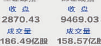
上证综指 收盘 2870.43 成交量 186.49亿股