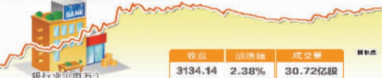
3月16日波动最大行业走势图