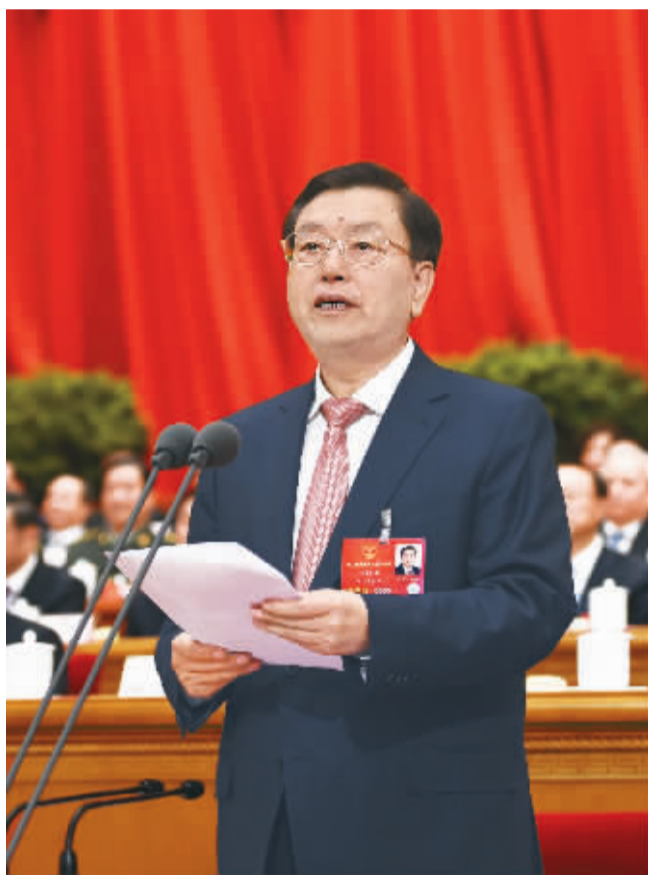
3月16日,十二届全国人大四次会议在北京人民大会堂闭幕。习近平、李克强、俞正声、刘云山、王岐山、张高丽等党和国家领导人在主席台就座。