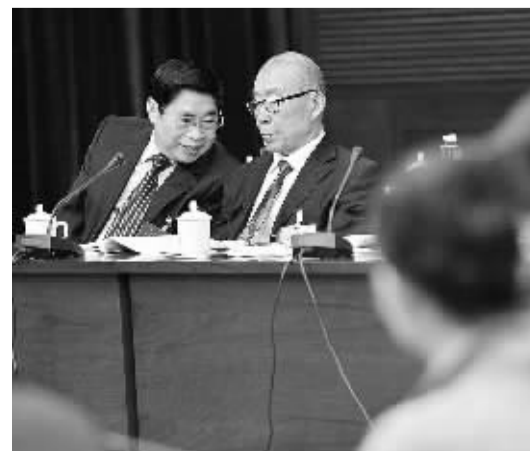
3月13日,人大山西代表团在驻地举行全体会议。全国人大代表袁纯清(左一)表示,作为煤炭大省,山西要加快化解煤炭过剩产能。

目前,河北钢铁企业申请商业银行贷款的难度较大,很多企业资金紧张,难以实施升级改造项目。杨崇勇代表说:“金融机构对钢铁企业贷款应区别对待,对有利于产品结构升级和有利于开展优势产能国际合作的项目应给予支持。”