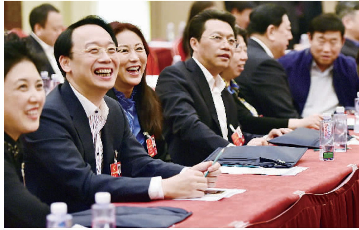
3月8日，人大黑龙江代表团举行全体会议，审查计划报告和预算报告。代表们纷纷就如何推动经济转型升级，如何重整黑龙江经济雄风建言献策。

还有一些人认为，缺钱的公司才上市，不缺钱的公司没有必要上市。其实不然，企业上市后会给企业带来极大的益处。上市有利于企业建立和完善现代企业制度，促进经营管理规范化，是企业做大做强的重要手段。而且，通过上市、发债等直接融资手段，企业可以降低融资成