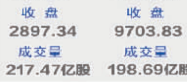
上证综指 收盘 2897.34 成交量 217.47亿股