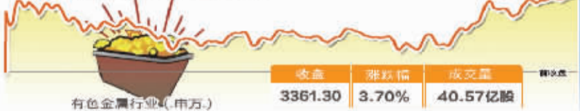
3月7日波动最大行业走势图