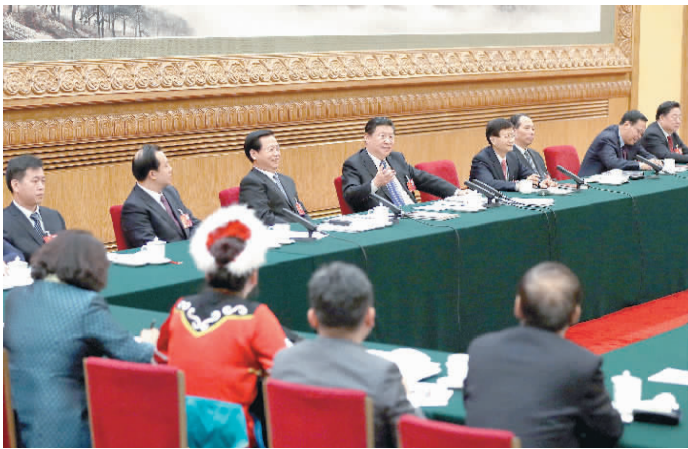
3月7日,中共中央总书记、国家主席、中央军委主席习近平参加十二届全国人大四次会议黑龙江代表团的审议。