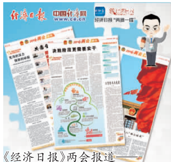
《经济日报》两会报道——

分析中国经济时,一位经济学家曾说,“经济学有一半是心理学”。昔日,中国企业家敢闯敢拼,曾勇立市场潮头,为“中国奇迹”贡献巨大力量。今天,提振发展信心,抢抓发展机遇,坚定转型脚步,中国的企业家还将释放巨大创造力,创造新的奇迹。