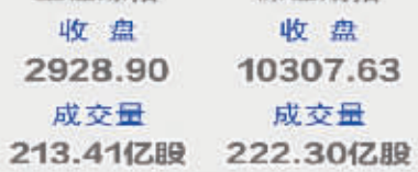
上证综指 收盘 2928.90, 成交量 213.41亿股