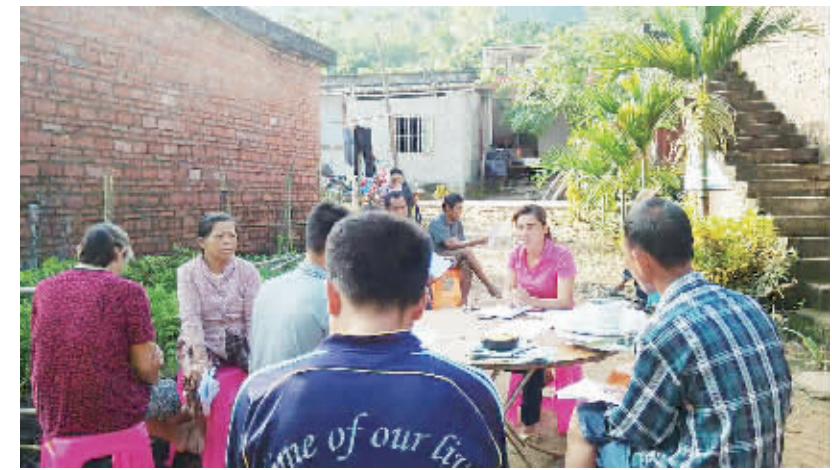
今年全国两会前夕,林美娟代表(右二)在村里与乡亲们座谈,收集他们对加快美丽乡村建设的意见和建议。

开栏的话 全国两会召开在即,一年来,全国人大代表、政协委员肩负着13亿多人民的期望,忠实履行职责,深入群众之中,听民声、纳民意、集民智、聚民意,用议案、提案、建议等多种形式为改革发展建言献策。从今天起,本报推出“基层代表委员履职故事”专栏,追踪一些议案、提案、建议产生的经过,见证基层代表委员恪尽职守的故事。