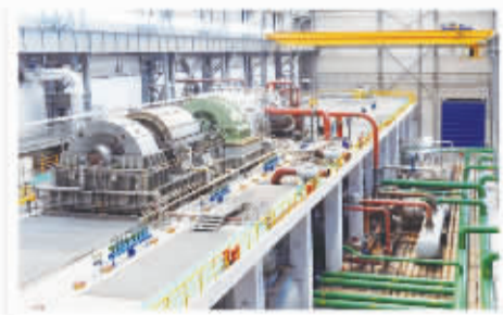
△ 10万等级空分装置用压缩机组。