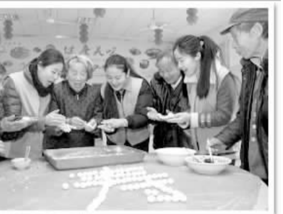
上图 为了让孤寡老人过一个欢乐喜庆的元宵节,2月21日,南昌铁路局团委青年志愿者来到南昌市东湖区福利院,为老人包汤圆并送上节日祝福。