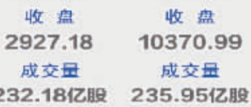
上证综指 收盘 2927.18 成交量 232.18亿股