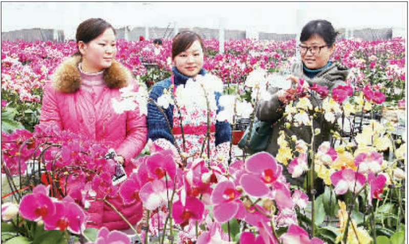
市民在安徽马鞍山市承接产业示范园选购年宵花，装点家居，扮靓春节。