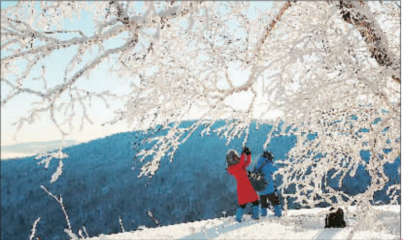
游客冒着零下30多摄氏度的低温在黑龙江鸡东县凤凰山国家森林公园内拍摄雾凇。当地因雪厚质优获得冰雪爱好者青睐。