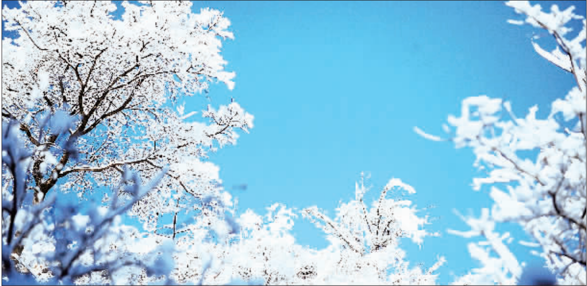
行山区多次降雪 河北狼牙山脚