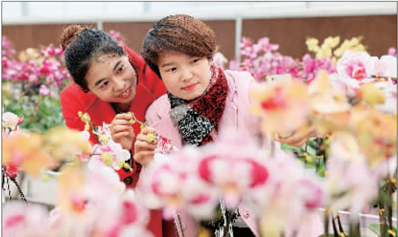
新春佳节，四川华蓥市君兰天下兰花基地万株“蝴蝶兰”迎春怒放，吸引不少市民前往踏春赏花。