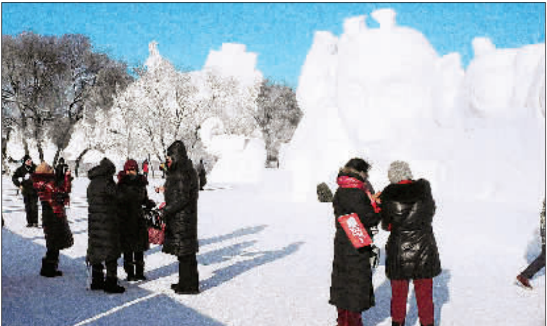
游客在吉林长春净月潭“净月雪世界”观赏雪雕。春节假日，游客在此赏冰玩雪度新春。