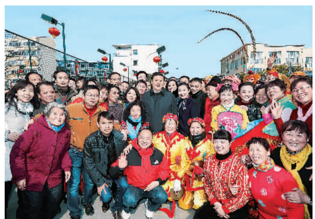
2月3日,习近平在南昌市东湖区彭家桥街道光明社区同居民们合影。