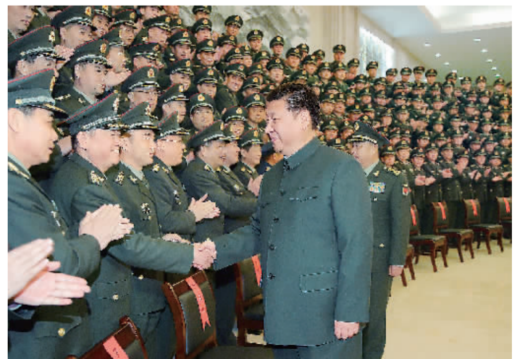
2月2日,习近平在南昌接见驻赣部队师以上领导干部和建制团单位主官,代表党中央和中央军委,向驻赣部队全体官兵致以诚挚问候,向全体解放军指战员、武警部队官兵、民兵预备役人员致以新春祝福。