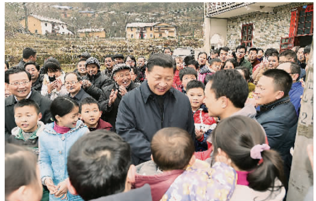
2月2日,习近平在井冈山市茅坪乡神山村给乡亲们拜年,祝乡亲们生活幸福、猴年吉祥。

新华社南昌2月3日电 中华民族传统节日农历猴年春节即将到来之际,中共中央总书记、国家主席、中央军委主席习近平来到江西,看望慰问广大干部群众和驻赣部队,祝全国各族人民健康快乐吉祥,祝改革发展人民生活蒸蒸日上,向全体解放军指战员、武警部队官兵、民兵预备役人员致以新春祝福。 冬日的赣鄱大地,寒冷中孕育着浓浓春意。2月1日至3日,习近平在江西省委书记强卫、省长鹿心社陪同下,来到吉安、井冈山、南昌等地,深入乡村、企业、学校、社区、革命根据地纪念馆调研考察,就贯彻落实党的十八届五中全会精神和中央经济工作会议、中央扶贫开发工作会议、中央城市工作会议精神进行指导,给广大干部群众送去党中央的新春祝福和亲切关怀。