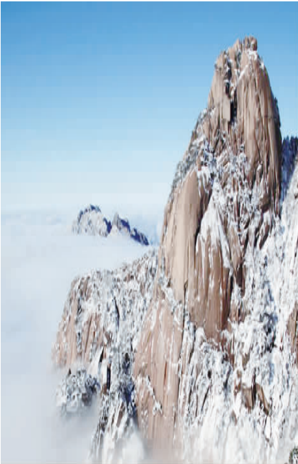
冬季的黄山美景，集雪、松、石、云、泉为一体，别有一番韵味。

天晚上最低温度零下22摄氏度，冻得过瘾！不这么冷，哪得‘处处路通琉璃界，时时身在水晶宫’的美景啊！” 喻老可能不知道，为了应对这场极寒天气，黄山风景区管委会可是铆足了劲儿。为了保证古木不被冻坏，园林部门全面启动了古树名木保护应急预案。他们全面检查重点古树名木的玻璃支撑杆件，提前储备了毛竹、刚竹等应急物资，并邀请古树名木保护专家组、树木力学专家亲临指导，确保古树名木安全。交管、交通管理部门加强交通秩序和营运车辆管理，及时做好公路铲雪除冰等应急准备工作，确保景区内道路畅通。各片综治组和景区开发管理部门加强路段巡查，及时组织力量清除险要路段、景点的路面冰雪，确保游客的生命财产安全。 在各种措施的保障之下，喻老玩得很尽兴：“我们在山上住了3天，每晚200多元，真值。”其实，冬游黄山，正如喻老所说，真是物超所值。据了解，12月至翌年2月是冬游的最佳季节。这个时间来，不