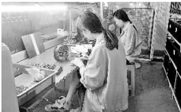
上图 广西制定了“加工贸易倍增计划”,未来3年,广西加工贸易额突破100亿美元,实现工业产值1000亿元。图为钦州市科技产业园一名女工在检查手机半成品的质量。 左下 图为深圳海关关员到加工贸易企业现场服务。 右下 图为位于福建省省长泰县兴泰开发区的加工贸易企业生产车间一角。