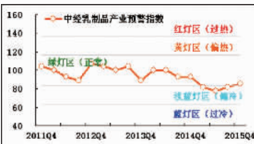
中经乳制品产业预警灯号图