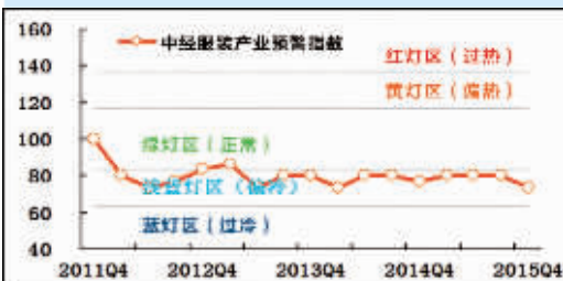
中经服装产业预警灯号图