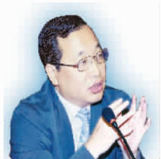
中国石化和化学工业联合会副会长