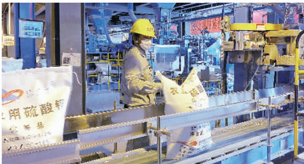
工人在罗布泊农用硫酸钾产品生产线上工作。

当前,供需失衡已成为影响化工行业经济运行的最主要矛盾。行业发展的当务之急,是要在做好供给侧结构性改革方面下功夫,近期应着力开拓五大市场