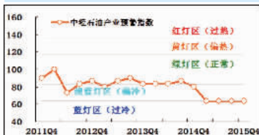
中经石油产业预警灯号图