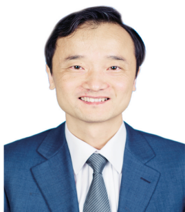
国家统计局中国经济景气监测中心副主任 潘建成