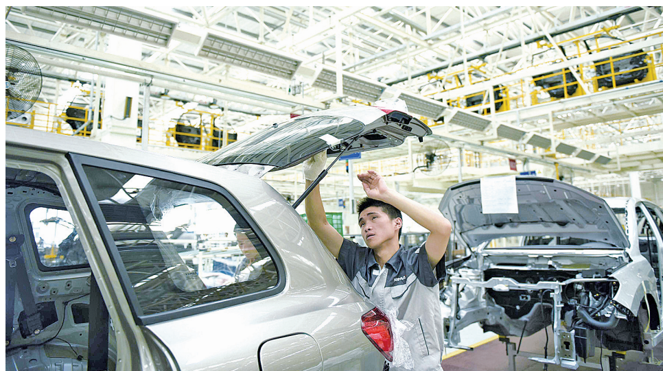
工人在川汽集团汽车生产基地内装配汽车。