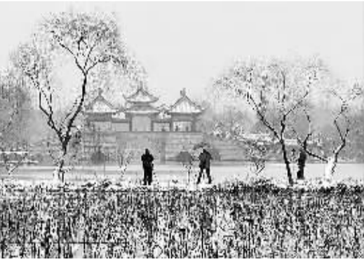
雪后的扬州银装素裹，犹如一幅山水画，别有韵味。