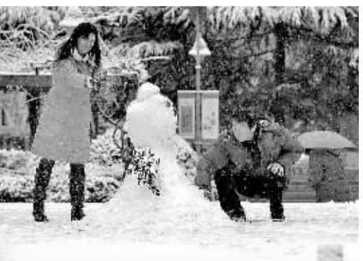
大雪让武汉披上了银装，人们走出户外享受堆雪乐趣。

执行主编 王薇薇 责任编辑 杨开新 美术编辑 高妍 联系邮箱 jjrbc@163.com