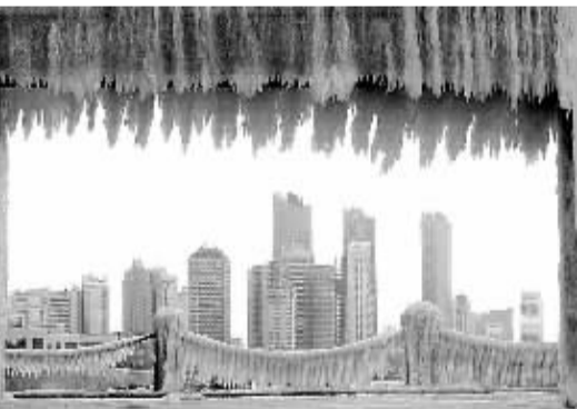
寒潮让烟台进入“速冻”模式，悬挂的冰凌尽显“千里冰封，万里雪飘”的美景。