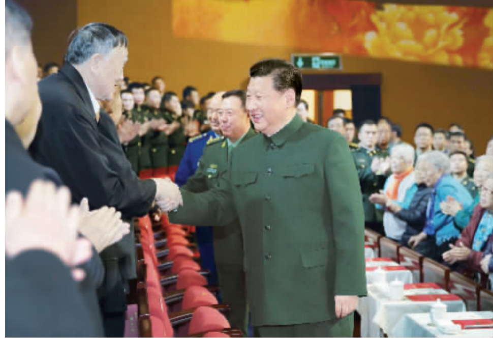
1月28日,中央军委慰问驻京部队老干部迎新春文艺演出在北京举行。中共中央总书记、国家主席、中央军委主席习近平出席,向在场的军队老同志,向全军离退休老干部,致以新春问候和祝福。

新华社北京1月28日电 (记者孙彦新) 中央军委慰问驻京部队老干部迎新春文艺演出28日在京举行。中共中央总书记、国家主席、中央军委主席习近平出席,向在场的军队老同志,向全军离退休老干部,致以新春问候和祝福。 清风吹拂迎新春,战歌嘹亮军旗扬。中华民族传统猴年春节即将到来之际,为民族独立和解放建立卓越功勋、为国家和军队建设作出突出贡献的驻京部队老干部欢聚一堂。回顾过去一年,大家深切感到,在党中央、中央军委和习主席坚强领导下,全军和武警部队扎实抓整顿、抓备战、抓改革、抓规划,国防和军队建设再上新台阶,书写了政治建军、改革强军、依法治军的崭新篇章。大家一致表示,新的一年要深入学习贯彻习主席系列重要讲话精神特别是国防和军队建设重要论述,以党在新形势下的强军目标为引领,沿着中国特色强军之路奋勇前进,不断开创强军兴军新局面。 文艺演出分为“铁血雄师”“清风浩荡”“奋楫前行”3个乐章,集中反映全军部队铸魂固本、整风整改、练兵备战、深化改革的新实践新气象,生动展现广大军民奋力实现中国梦强军梦的时代风采。雄壮激昂的大合唱《改革强军路上》拉开了演出序幕。合唱《把青春压进枪膛》、领唱与合唱《钢铁舰队进行曲》《强大机群向前飞》《点火》《如虎添翼》《忠诚卫士歌》《当那一天来临》、集体舞《决胜疆场》,表达了全军各军兵种和武警部队将士英勇顽强、敢打必胜的昂扬斗志。领唱与合唱《古田新风吹过来》《英雄万岁》《四有军人歌》《天下乡亲》、联唱《优良传统代代传》,唱传统、赞英雄、扬正气,展示了全军部队深入贯彻落实全军政治工作会议精神,弘扬优良传统、永葆宗旨本色的新风新貌。舞蹈《看齐·看齐》、领唱与合唱《强军之路》,表达了全军官兵坚决听从党中央、中央军委和习主席指挥,积极投身改革强军的钢铁意志。领唱与合唱《大地芬芳》、合唱《天耀中华》,表达了军民同心共筑中国梦的美好追求,抒发出人民群众和部队官兵对以习近平同志为总书记的党中央高度信赖、衷心拥戴的真挚感情。 中共中央政治局委员、中央军委副主席范长龙,中共中央政治局委员、中央军委副主席许其亮,中央军委委员常万全、房峰辉、张阳、赵克石、张又侠、吴胜利、马晓天、魏凤和陪同观看。 观看演出的还有军队老同志代表,军委机关各部门、驻京各大单位和武警部队领导。