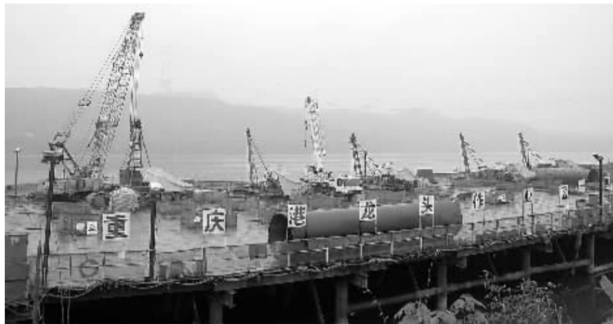
重庆港涪陵港区龙头作业区施工现场。