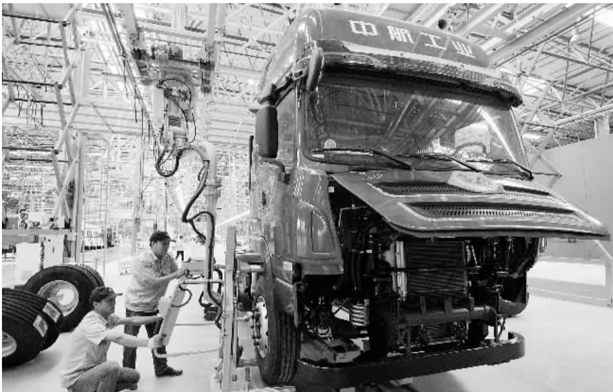
由中航工业集团投资50亿元，在河北邢台规划建设的中航长征（邢台）中重卡、特种车及装备生产基地项目一期一阶段工程日前完工，首款重卡新车顺利下线。据了解，该基地全部建成投产后，年产整车2.5万辆，年产值230亿元。图为两名工人在安装重型卡车轮胎。

连维良表示，今年春运将把信用建设作为工作重点，打造“诚信春运”。目前，铁路总公司已梳理出失信行为类别，民航局已确定11种不文明行为，将尽快出台具体办法，争取今年春运期间就对失信行为进行记录。