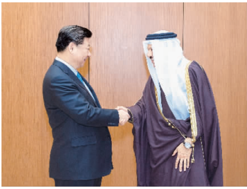
1月19日，国家主席习近平在利雅得会见海湾阿拉伯国家合作委员会秘书长扎耶尼。

习近平指出，海合会是中东地区最具活力的地区组织。中国同海合会建立联系35年来，中海关系日臻成熟，双方合作具有扎实基础和广阔发展前景。希望双方开拓进取，凝聚更多契合点，提高双方关系水平，推动中海互利合作更多惠及双方人民。双方要保持高层交往势头，巩固彼此政治互信，加强沟通和协调，实现彼此发展规划战略对接。中方愿结合“一带一路”建设，同海合会国家开展互利合作。中方愿成为海合会国家长期、稳定、可靠的能源供应市场，同海方构建上下游全方位能源合作格局。双方要深化基础设施建设、通信、电力、投资、金融、航天、核能、可再生能源等领域合作。我们欢迎中国—海合会自由贸易区谈判重启，很高兴谈判取得实质性进展，希望自贸区早日建成。要提高安全合作水平，密切在地区和国际事务中的沟通协调。习近平强调，中方支持海合会国家为维护地区和平稳定所作努力，支持海合会国家在地区热点问题中发挥建设性作用。希望地区国家本着相互尊重、互不干涉内政、睦邻友好原则，通过对话和合作，共建共享中东