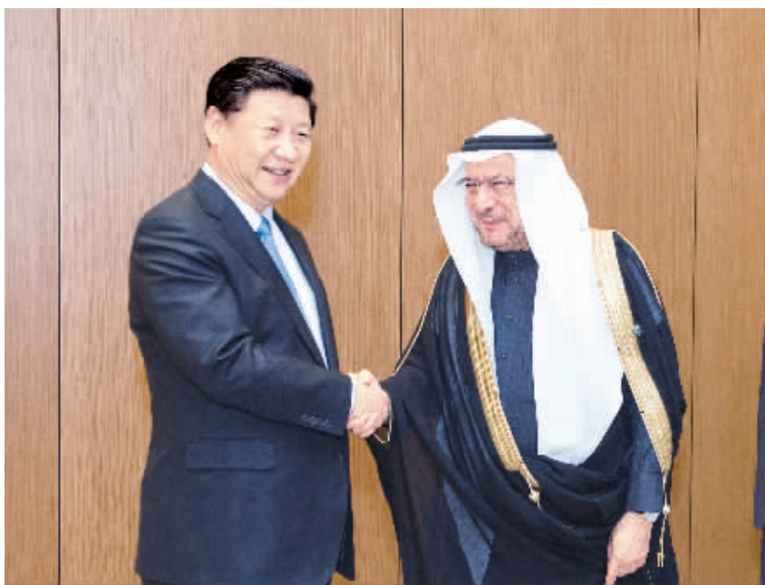
1月19日，国家主席习近平在利雅得会见伊斯兰合作组织秘书长伊亚德。

习近平指出，中国和伊斯兰国家有着天然、传统的友好关系，中国永远是伊斯兰国家的好朋友、好伙伴、好兄弟。伊斯兰合作组织是伊斯兰国家团结的象征，在国际和地区事务中作用独特，为促进伊斯兰国家合作作出了重要贡献。中方和伊斯兰合作组织开展友好交往40多年来，确立了不同文明、不同宗教、不同社会制度的相处之道。中方欢迎伊斯兰合作组织发挥桥梁作用，为中国同伊斯兰国家关系发展注入更多正能量。