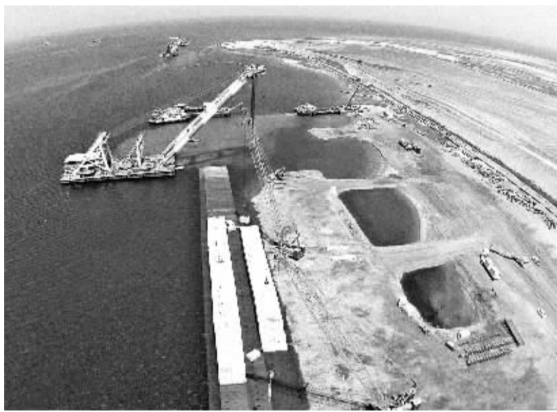
图为沙特吉达港口疏浚项目施工现场。