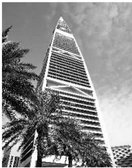
图为沙特利雅得地标建筑费萨莉亚塔。