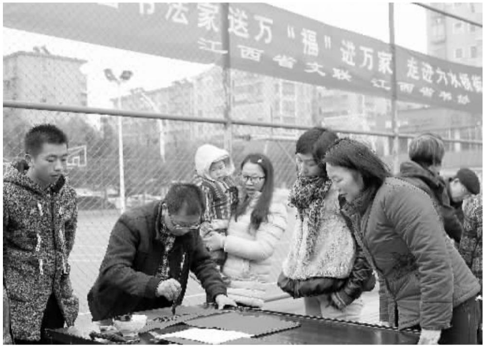
1月9日,由江西省文联、江西省书协主办,抚州市文联、抚州市书协等协办的“万名书法家送万福进万家”活动在六水桥小游园举行,现场书法家们挥毫泼墨,写福字、送春联,把最美好的祝福奉献给市民。