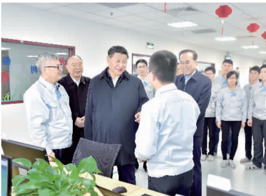
1月4日下午,习近平在重庆京东方光电科技有限公司技术研发中心与研发人员交流。

新华社重庆1月6日电 中共中央总书记、国家主席、中央军委主席习近平近日在重庆调研时强调,创新、协调、绿色、开放、共享的发展理念,是在深刻总结国内外发展经验教训、分析国内外发展大势的基础上形成的,凝聚着对经济社会发展规律的深入思考,体现了“十三五”乃至更长时期我国的发展思路、发展方向、发展着力点。全党同志要把思想和行动统一到新的发展理念上来,崇尚创新、注重协调、倡导绿色、厚植开放、推进共享,努力提高统筹贯彻新的发展理念能力和水平,确保如期全面建成小康社会、开启社会主义现代化建设新征程。