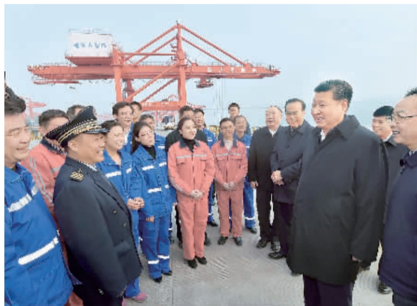
1月4日下午,习近平在重庆两江新区果园港与现场作业人员亲切交谈。

随后,习近平步行前往码头前沿平台,视察长江航运和港口装卸作业。得知总书记来了,现场作业人员、货船船主、港口规划建设人员纷纷过来向总书记问好,习近平同他们握手,祝他们新年好,叮嘱他们把港口建设好、管理好、运营好,以一流的设施、一流的技术、一流的管理、一