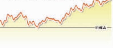
1月6日上证综指走势图