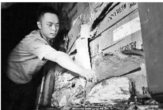
因为拱北海关查获的走私冻品。

经查,该案是由一个专门从事海上偷运走私冻品进境的团伙和一个组织岸上接货运输的团伙共同实施的犯罪行为。截至案发,上述团伙共计走私4次,总重量约1170吨,初步估计总案值约2679万元。