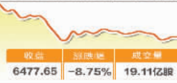
1月4日波动最大行业走势图