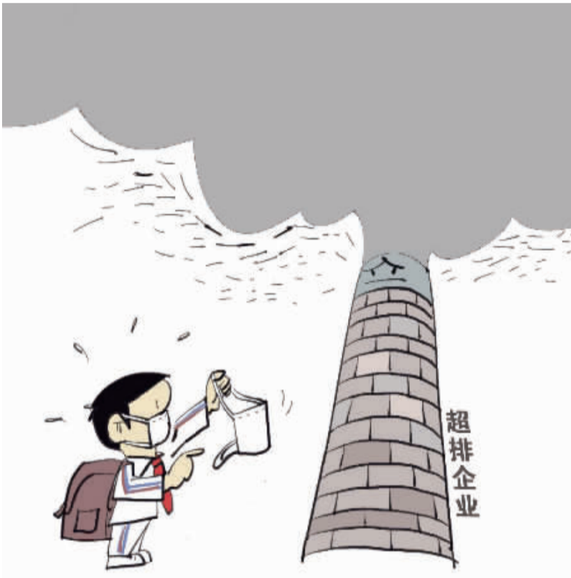
新华社记者 冯印澄作

“世异则事异,事异则备变”。我国制造业在转型的过程中难免遭遇“成长的烦恼”,但在发展方向上不能犹豫彷徨,而应坚定向前。具体来说,就是要放眼全球,加快战略部署,在借鉴制造业强国经验的基础上,加强顶层设计,重视信息化建设和大数据产业开发,布局核心智能制造技术,不断提升产业化水平。