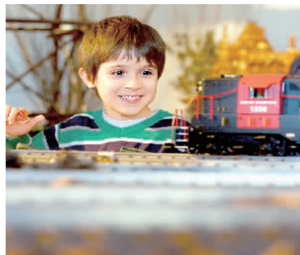
12月13日,一名小男孩在美国纽约植物园观看2015年节日小火车展。纽约植物园的节日小火车展是纽约圣诞节节的传统活动之一。

据报道,西共体部分内部机构出现人员欠薪情况。目前,在15个成员国中,有11个是联合国界定的世界最不发达国家。