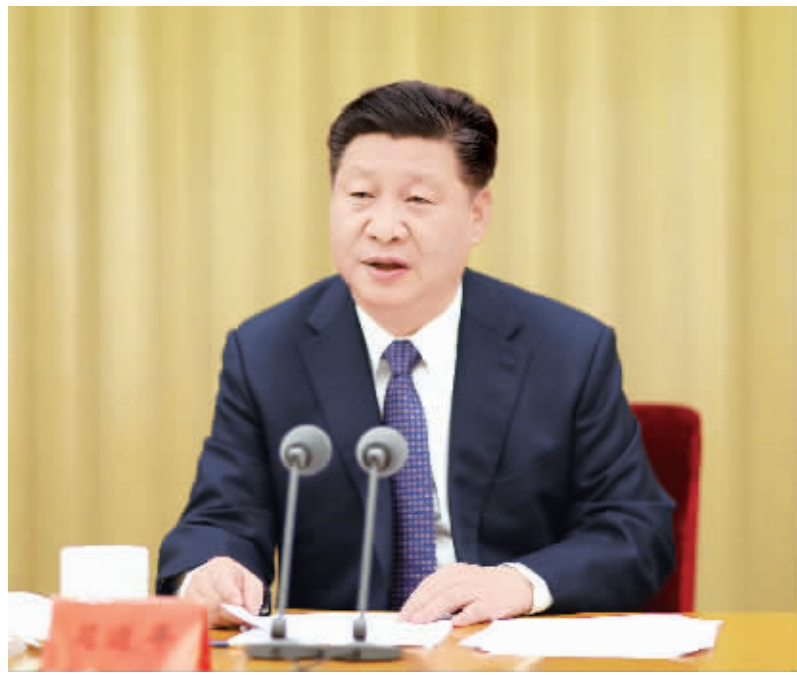
12月11日至12日,全国党校工作会议在北京召开。中共中央总书记、国家主席、中央军委主席习近平发表重要讲话。

习近平强调,党性教育是共产党人修身养性的必修课。各级党校要把党性教育作为教学的主要内容,深入开展理想信念教育、党的宗旨教育,把党章和党规党纪学习教育作为党性教育的重要内容。党校党性教育单元要加大力度,增加分量,安排足够时间,形成党性教育课程体系,有效改进党性教育方式方法,提高党性教育实效。