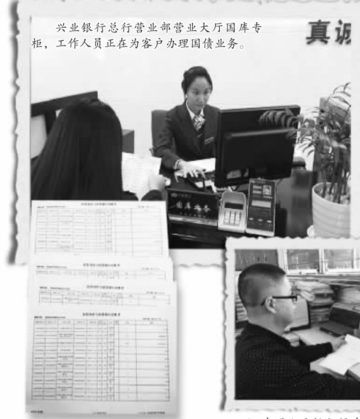
兴业银行总行营业部营业大厅国库专柜，工作人员正在为客户办理国债业务。

记者： 我国的财政收入主要由税收收入构成，2014年我国的税收收入已经超过10万亿元，请问税收收入是如何缴入国库的？