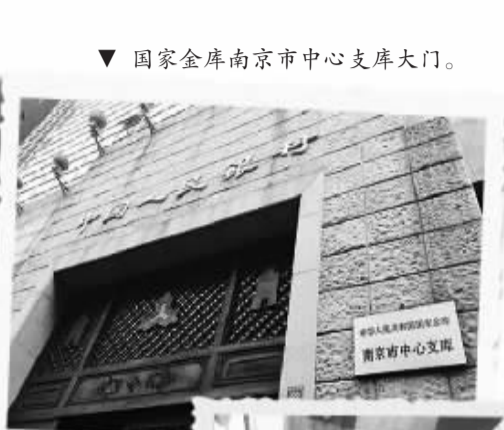
国家金库南京市中心支库大门。