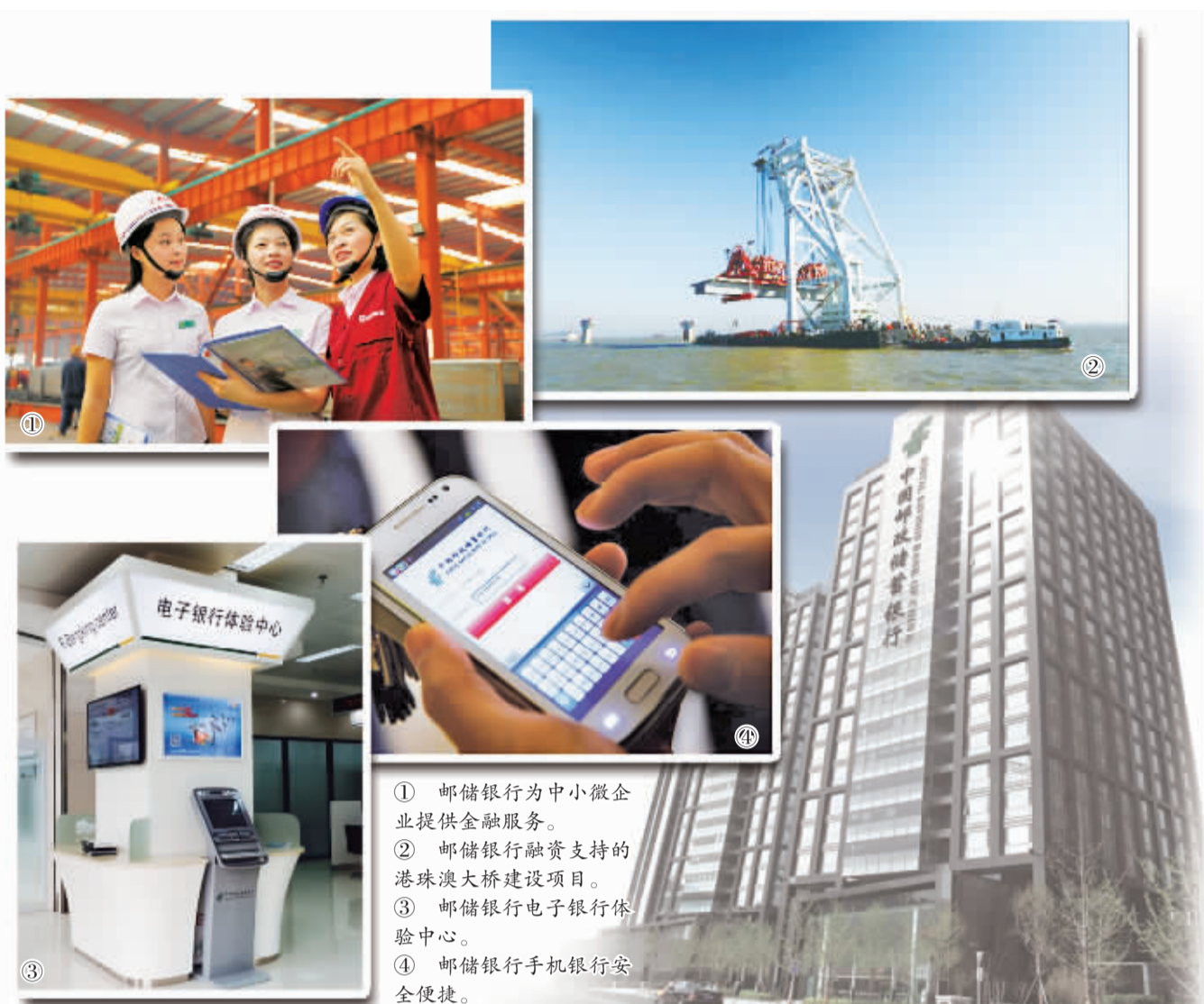
① 邮储银行为中小微企业提供金融服务。 ② 邮储银行融资支持的港珠澳大桥建设项目。 ③ 邮储银行电子银行体验中心。 ④ 邮储银行手机银行安全便捷。

12月9日，中国邮政储蓄银行在北京举办新闻发布会宣布，邮储银行引进战略投资者工作，已于日前正式获得银监会批准，实现了从中国邮政集团公司单一股东向股权多元化的成功迈进。