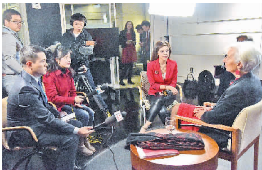
11月30日,在美国首都华盛顿,国际货币基金组织总裁拉加德(右)接受媒体专访。

SDR是IMF于1969年创设的一种国际储备资产,用以弥补成员国官方储备不足,其价值目前由美元、欧元、英镑和日元组成的一篮子储备货币决定。