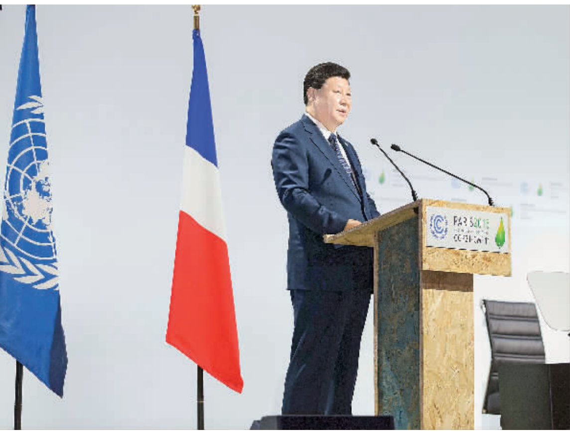
11月30日,国家主席习近平在巴黎出席气候变化巴黎大会开幕式并发表题为《携手构建合作共赢、公平合理的气候变化治理机制》的重要讲话。