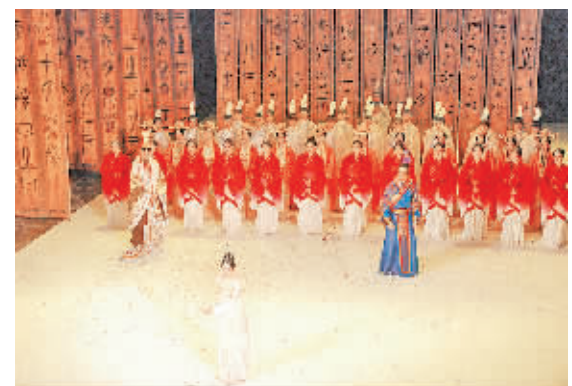
中国歌剧舞剧院原创大型民族舞剧《孔子》日前在保加利亚索非亚国家歌剧院隆重上演。该剧用中国民族舞的表现形式演绎孔子周游列国的典故，反映了孔子将儒家思想付诸实践的艰难过程。舞者们飞扬的舞姿、精美的服装和道具布景、跌宕起伏的剧情让全场演出高潮迭起。此次演出是落实中国—中东欧合作贝尔格莱德纲要的一项重要活动。

泰国副总理颂奇·乍都西披他表示，该项政策主要包括税费减免和信贷放宽，目的是减轻购房者的负担，鼓励居民购房。泰国政府将通过国营住房银行向月收入低于845美元的群体发放总规模为2.82亿美元的低息贷款。与此同时，土地流转税和房屋抵押登记费将分别由购房款的2%和1%均降低至0.01%。