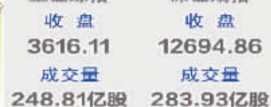
新三板总成交额突破17亿元关口