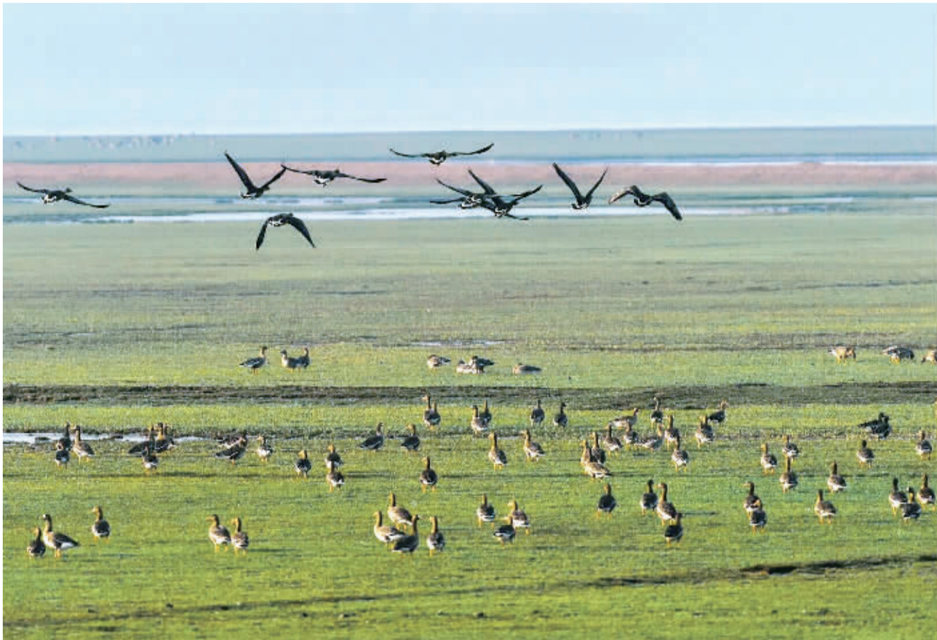
每逢秋冬季节，成群结队的候鸟来到安徽安庆菜子湖湿地栖息，每天达到5万只。

从2003年开始，余山地区一直在进行改造，一些适合上海生长的乡土树种如麻栎、山胡椒、丝棉木、苦槠、青冈栎等在余山地区大量种植，使得植物种类日趋丰富，给野生动物的栖息创造了条件。另一方面，余山地区对野生动物的保护力度日渐加强，附近居民的减少也给野生动物的生长提供了空间。现在，山上有穿山甲、豹猫、貉等国家保