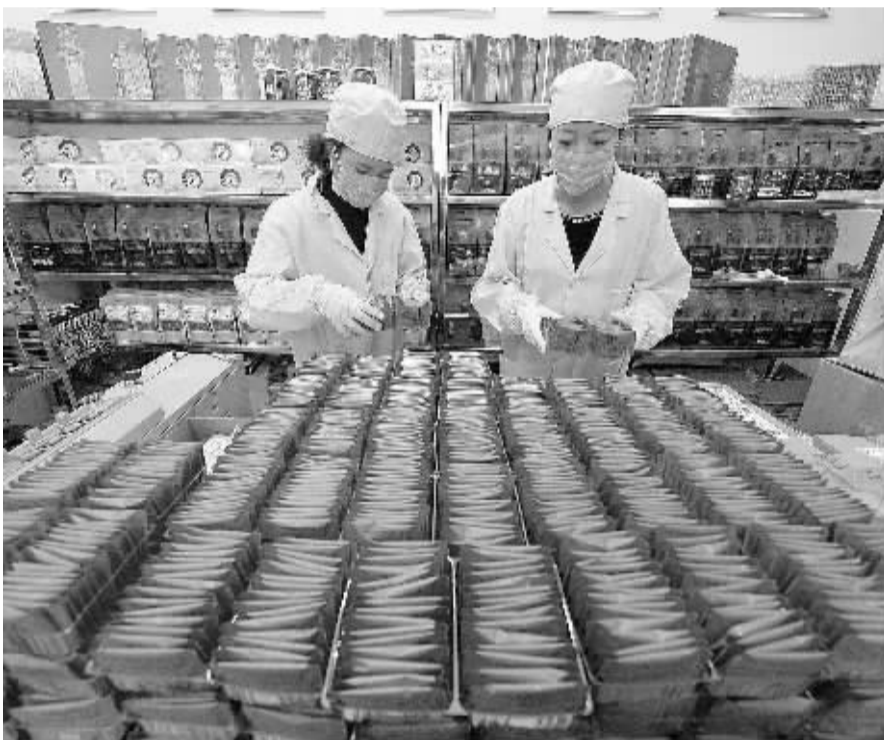
11月10日，宁夏贺兰县习岗镇德胜村村民正在包装网上销售的枸杞，准备发货。据了解，今年宁夏正式启动“2015千村电商工程”。

此外，不少专家还建议，发展农村电子商务，政府也要加强规划引导，充分发挥已有平台和第三方平台作用，防