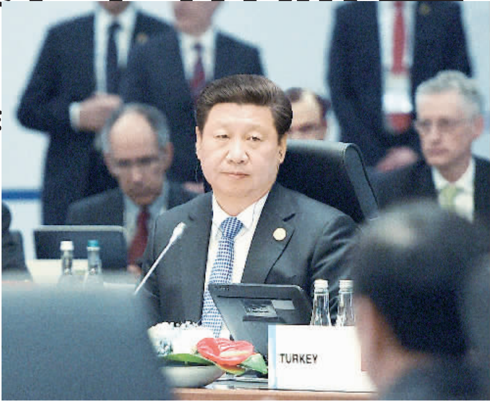
11月15日,二十国集团领导人第十次峰会在土耳其安塔利亚举行。国家主席习近平出席并发表题为《创新增长路径 共享发展成果》的重要讲话。这是习近平出席第一阶段会议。