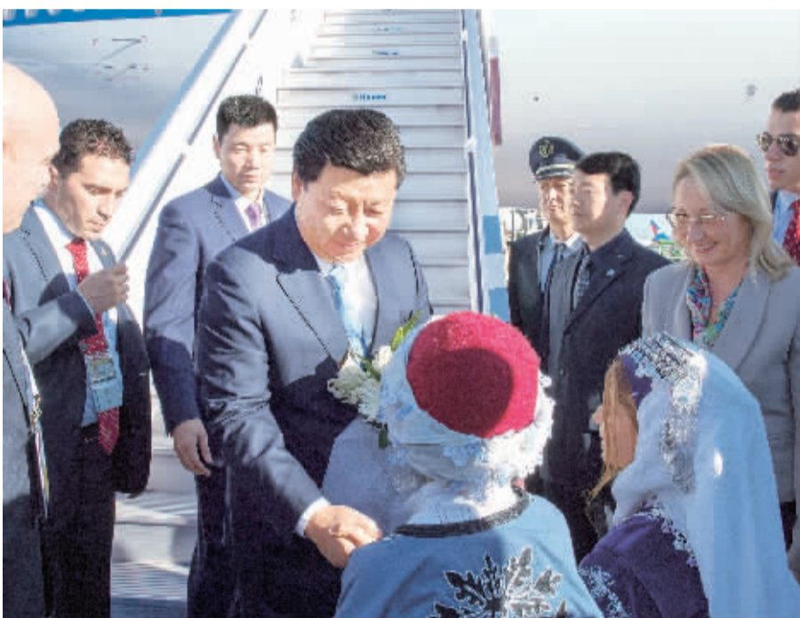
11月14日,国家主席习近平抵达土耳其安塔利亚,应土耳其共和国总统埃尔多安邀请,出席二十国集团领导人第十次峰会。这是土耳其儿童向习近平主席献花。