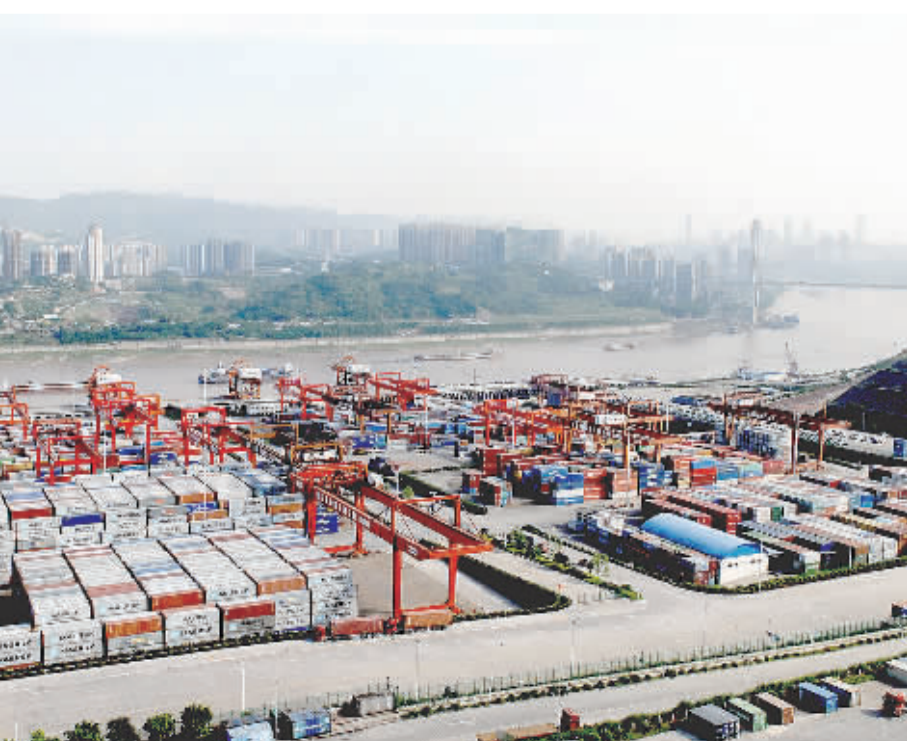
这是位于两江新区的重庆两路寸滩保税港区。该港区是我国内陆首个保税港区,拥有“水港+空港”的一区双核优势。