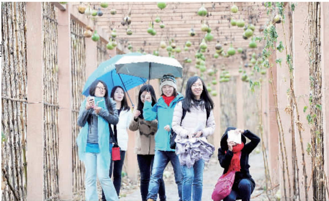
游客在延庆县大庄科乡慈母川村游玩。该村依托慈孝文化底蕴浓厚特色, 发展乡村旅游, 助力村民增收。

本报讯 记者杨学聪报道: 开民俗户等级评定先河, 搭建贷款担保平台, 盘活资源建设乡村酒店……近年来, 北京延庆出台多项利好政策, 通过创新机制和做法打造乡村旅游“升级版”, 让产业发展惠及广大群众。