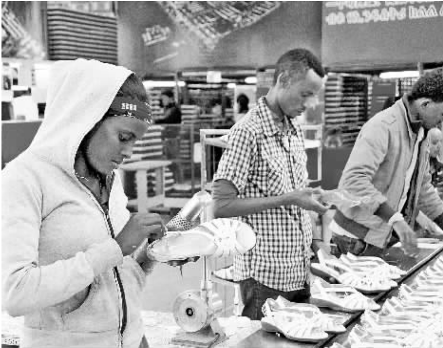
中国民营企业投资兴建的埃塞俄比亚东方工业园内的华坚鞋城生产车间，每天可以生产5000双成品鞋，全部销往美国市场。