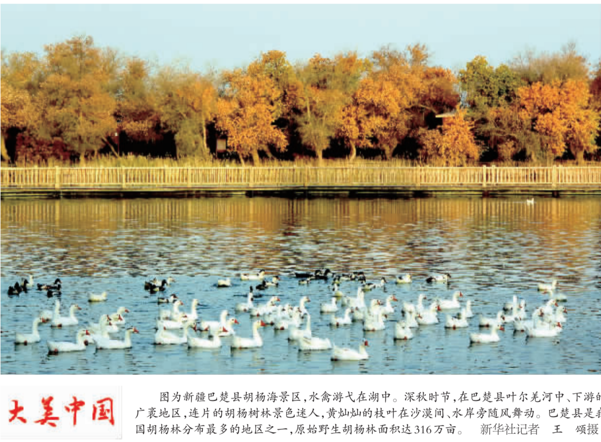
图为新疆巴楚县胡杨海景区,水禽游弋在湖中。深秋时节,在巴楚县叶尔羌河中、下游的广袤地区,连片的胡杨树林景色迷人,黄灿灿的枝叶在沙漠间、水岸旁随风舞动。巴楚县是我国胡杨林分布最多的地区之一,原始野生胡杨林面积达316万亩。

内页点睛 新一轮农村改革指向三大重点领域 中央农村工作领导小组办公室有关负责人就《深化农村改革综合性实施方案》涉及的农村集体产权改革、城乡一体化体制机制、农业支持保护制度等3大重点领域进行了解读。 4版 放权为了放活 管好才能管用 近日,国务院印发了《关于改革和完善国有资产管理体制的若干意见》。财政部负责人接受《经济日报》记者采访,详解如何推进改革和完善国有资产管理体制。 5版 我国完成亚投行立法机构批准程序 十二届全国人大常委会第十七次会议第三次全体会议,表决通过了《亚洲基础设施投资银行协定》,标志着《协定》已正式经过国内立法机构批准。亚投行有望于今年年底前正式成立。 10版 C919如何影响中国工业 C919的成功研制,不仅推动着我国工业技术的进步,也推动了工业材料的革命,并让众多国内企业参与其中,给我国民航工业乃至基础工业带来了脱胎换骨的提升。 11版