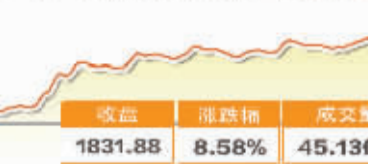
11月4日波动最大行业走势图