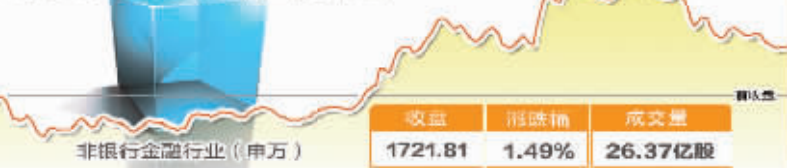
10月30日波动最大行业走势图