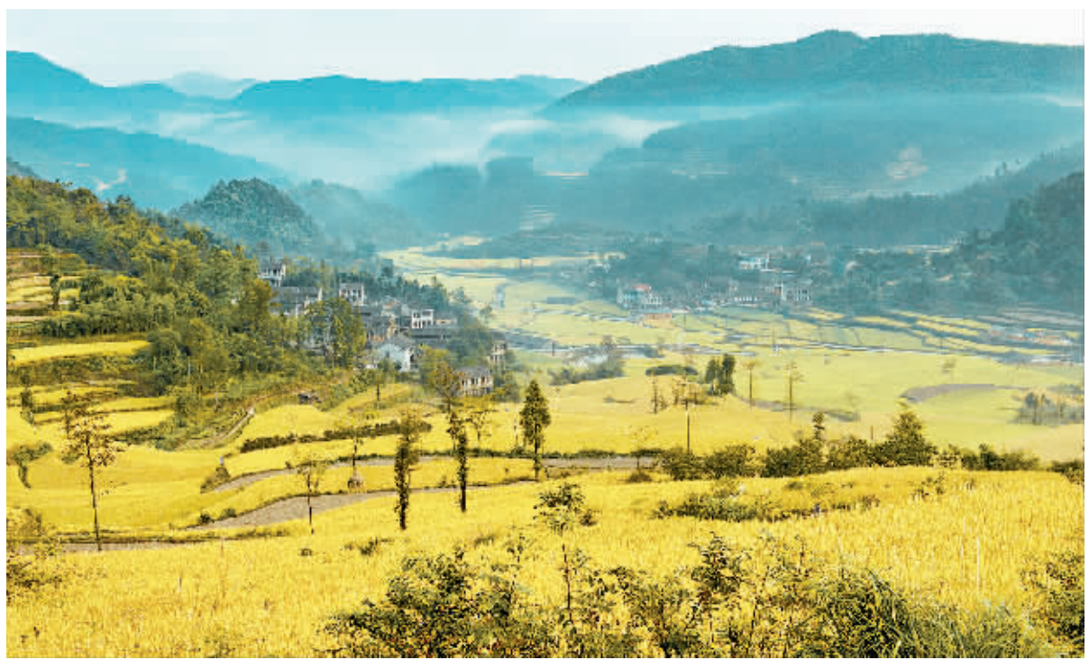
浙江省奉化市大堰镇西畈村高山稻谷丰收美景。