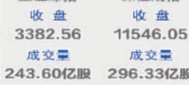
上证综指 收盘 3382.56 成交量 243.60亿股